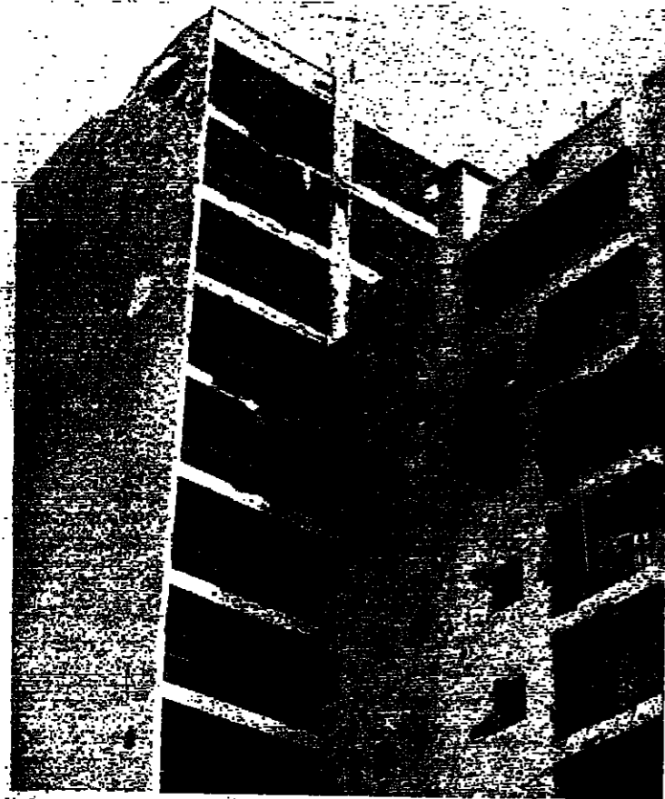
بيات الدفاع المدني في عين الرمانة